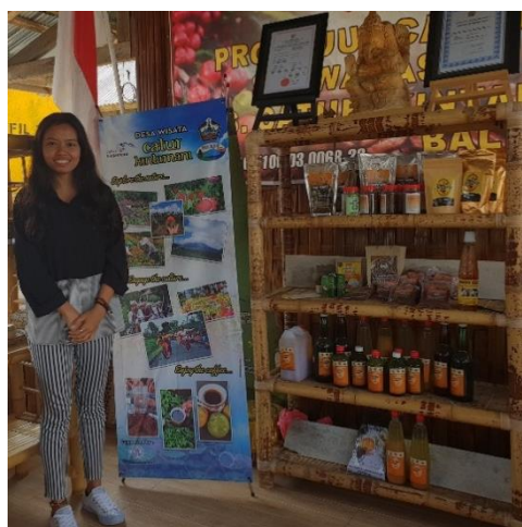
Gambar 4. Sarana Promosi (X-Banner)

Bahan promosi Desa Wisata Catur mengangkat potensi wisata alam, wisata budaya, dan wisata agro yaitu perkebunan dan pengolahan kopi serta produk perkebunan lainnya, termasuk produk olahan herbal binaan Universitas Dhyana Pura. Di samping itu, brosur desa wisata memuat gambaran rencana kegiatan trekking setengah hari yang dapat dilakukan oleh wisatawan yang berkunjung ke Catur. Bahan promosi cetak baik yang static mapun yang mudah dibawa ( portable ) merupakan sarana pemasaran yang baik dan praktis dan dapat digunakan oleh Pokdarwis Desa Catur apabila ada event berupa pameran dan sejenisnya untuk mempromosikan bauran pariwisata yang ada di desanya.