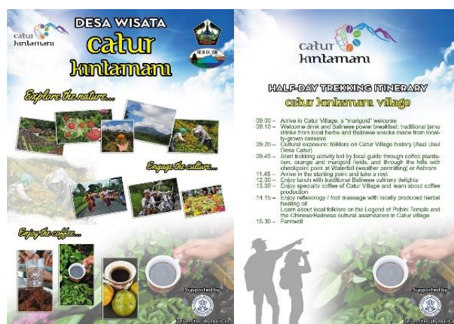
Gambar 5. Sarana Promosi (Brosur)