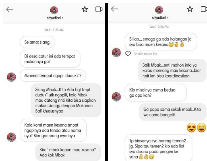
Gambar 3. Kotak Masuk Akun Instagram