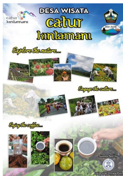
Gambar 8. Tagline Desa Wisata

Khusus untuk olahan kopi sebagai produk unggulan Desa Catur sekaligus salah satu daya tarik utama Desa Wisata Catur, tim merekomendasikan menjadikannya keunikan yang dapat “dijual” oleh Pokdarwis Desa Catur ( Unique Selling Proposition ) dengan slogan “Catur coffee: God’s gift to mankind” karena di Desa Catur kopi selain diolah hasil bijinya, juga dimanfaatkan untuk berbagai produk antara lain teh daun kopi, the cascara (dari olahan kering ceri kopi), teh benalu kopi, pengharum ruangan dari kopi, dan pupuk cair yang diolah dari lendir bekas fermentasi kopi.