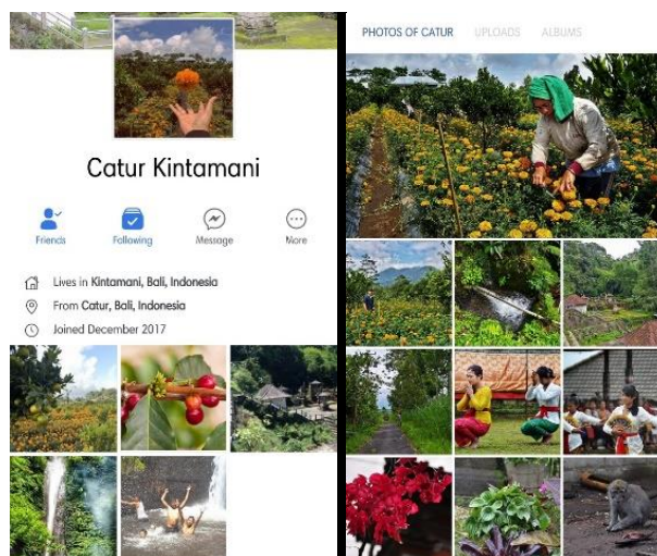
Gambar 1. Akun Facebook "caturkintamanivillage"

Terbukti, melalui akun Facebook dan Instagram Catur Kintamani Village, sudah mulai memiliki banyak followers dan sudah ada yang menanyakan tentang bagaimana berwisata ke Desa Catur melalui fitur messenger . Akun media sosial ini akan dikelola bersama oleh tim Undhira yang secara berkelanjutan akan membuat posting tentang Desa Wisata Catur dan oleh seksi promosi dan fotografi Pokdarwis Desa Catur, setelah mendapatkan pelatihan dari tim Undhira.