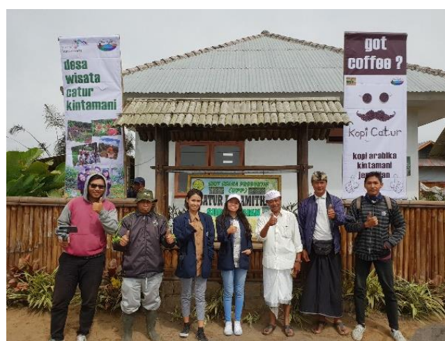
Gambar 6. Tim dan Pengurus Inti Pokdarwis di Depan T-Banner Catur