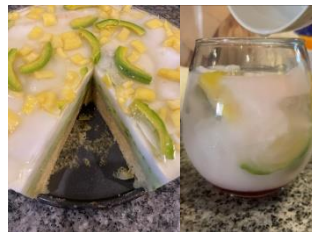
Table 1. pembuatan cake pudding es teler

Penyelenggaraan Event Romantic Dinner ini menghasilkan resep makanan Cake Pudding Es Teler dan Mocktail Es Teler yang telah dibuat sesuai standart resep yang telah dibuat oleh tim penulis. yang disajikan pada Event Romantic Dinner . Hasil yang diperoleh oleh tim penulis, agar dapat menjadi inspirasi. Agar masyarakat dapat berinovasi dalam makanan-makanan tradisional agar lebih banyak dikenal.