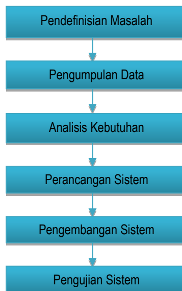
Gambar 2. Tahapan SDLC Waterfall