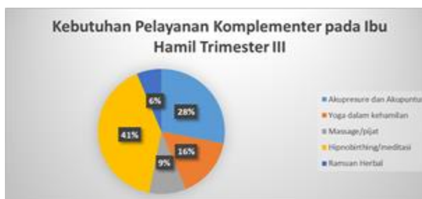
Gambar 3. Identifikasi Kebutuhan Pelayanan Komplementer pada Ibu Hamil Trimester III di Kota Denpasar

Pada gambar 2 dijelaskan bahwa kebutuhan layanan yoga selama masa kehamilan merupakan layanan yang terbanyak dibutuhkan ibu hamil dengan usia kehamilan trimester II, selain itu layanan hypnobirthing dibutuhkan 26% ibu, 20% ibu membutuhkan layanan massage/pijat, layanan akupresur dan akupuntur dibutuhkan sebanyak 17% ibu dan sebanyak 7% ibu membutuhkan layanan ramuan herbal selama menjalani kehamilan trimester II.