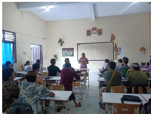
Gambar 5. Evaluasi dan monitoring

Program sosialisasi dan pendampingan penulisan karya tulis ilmiah berjalan selama kurang lebih tiga bulan berlangsung secara efektif terbukti dari tingkat kehadiran siswa mencapai 98% di setiap sesi kegiatan. hal ini juga mendukung ketercapaian tujuan kegiatan pendampingan karya tulis. Dapat dijelaskan juga bahwa para siswa cenderung memulai menulis dari bagian isi karya tulis yang meliputi latar belakang permasalahan, tujuan, landasan teori dan metode. Bagian isi dianggap bagian yang paling utama dan lebih rumit untuk ditulis karena memerlukan penalaran yang lebih tinggi. Hal ini terlihat dari nilai indeks rata-rata ketercapaian berdasarkan instrumen penilaian kompetensi menulis, dimana pada bagian isi mendapat nilai rata-rata paling tinggi pada pre test dan post test dibandingkan bagian awal dan akhir karya tulis ilmiah (Tabel 3)