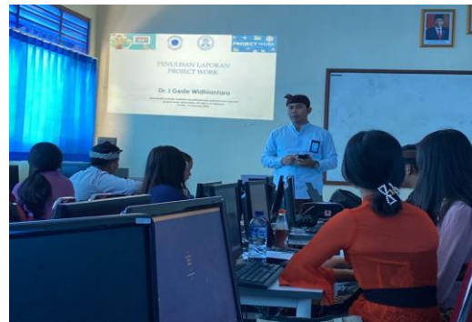
Gambar 1. Sosialisasi Materi Penulisan Karya Tulis dan Laporan Project Work

Pada tahun sebelumnya siswa kelas XII yang mengikuti ujian UKK diberikan banyak masukan oleh penguji kompetensi khususnya dalam tata cara penulisan laporan yang baik. Sehingga sekolah dalam hal ini ketua program studi sebagai mitra pada kegiatan ini menyelenggarakan suatu program pembimbingan penulisan karya tulis ilmiah kepada siswa-siswa yang diikuti para guru untuk meningkatkan kemampuan membimbing dan kompetensi menulis laporan ilmiah.