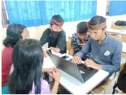
Gambar 4. Diskusi Laporan Ilmiah Dalam Kelompok