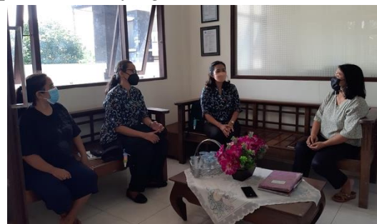
Gambar 2. Observasi tim PKM

Kegiatan PKM diawali dengan observasi untuk mengetahui permasalahan yang dialami oleh mitra (ditampilkan pada Gambar 2). Kemudian tim PKM berdiskusi untuk memberikan solusi terhadap permasalahan yang dialami oleh mitra.