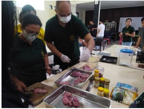
Gambar 4. Pengolahan Nugget Lele (a); Bakso Ayam (b); Dendeng Babi (c)