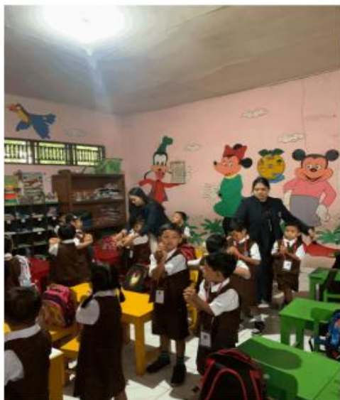
Gambar 2. Pelatihan Brain Gym di TK Widya Bhakti

Program brain gym di Kelompok A dan Kelompok B TK Widya Bhakti menunjukkan bahwa meskipun anak-anak antusias dan penasaran dalam mempelajari gerakan-gerakan brain gym , anak masih memerlukan pendampingan lebih dalam pelaksanaannya karena belum sepenuhnya familiar dengan gerakan tersebut. Hasil dari implementasi program ini mengindikasikan adanya peningkatan konsentrasi anak setelah melakukan brain gym , sehingga menunjukkan potensi besar program ini untuk diterapkan secara berkelanjutan. Untuk mendukung kelanjutan program ini, langkah selanjutnya adalah membuat video edukasi yang ditujukan kepada para guru TK Widya Bhakti. Video ini akan berfungsi sebagai panduan praktis bagi guru dalam mengajarkan dan memandu anak-anak melakukan gerakan brain gym , sehingga program ini dapat diintegrasikan dengan mudah ke dalam rutinitas harian di kelas dan menjadi bagian dari program jangka panjang untuk mendukung perkembangan konsentrasi dan keterampilan motorik anak-anak.