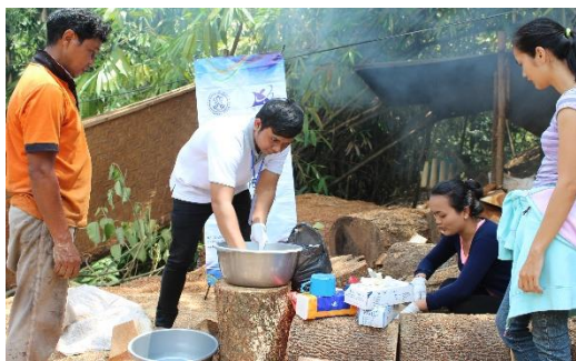
Gambar 2. Pendampingan Pengolahan Limbah Kayu menjadi Briket