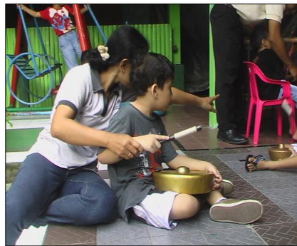
Gambar 5. Proses stimulan pada peserta didik

Selanjutnya pengenalan bermain musik pada anak usia dini dengan media musik Bali atau gamelan Bali di samping dalam upaya pelestarian juga diharapkan agar bisa menjadi media stimulan untuk merangsang kecerdasan anak. Mengingat kecerdasan anak harus diperhatikan dari sejak dini, maka kegiatan ini harus dilaksanakan dengan baik, terarah, terukur dan tercapai. Sesungguhnya banyak media yang berpengaruh untuk menstimulasi intelegensia manusia, salah satunya adalah musik. Musik telah masuk ke dalam jenis kecerdasan ganda dari sembilan tingkat kecerdasan yang disebut dengan intelegensi musikal (Gardner dalam Paul Suparno, 2008 : 36-38). Persoalan musik dijadikan sebagai media stimulan memang masih belum menjadi fokus perhatian masyarakat dalam konteks budaya Indonesia. Kendatipun dilakukan, hal ini hanya oleh beberapa orang tua saja, atau pegiat dunia seni dan lembaga pendidikan yang memahami bahwa untuk merangsang intelegensi anak usia dini dapat dilakukan dengan multimedia (banyak sarana), salah satunya melalui media seni musik.