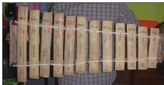
Gambar 3 . Instrumen Tingklik

Pengenalan akustika pada konteks penelitian adalah pengenalan tiga buah nada yaitu nada ndang ( ), ndung ( ), dan ndeng ( ) yang ada pada instrumen tingklik (alat musik berbilang yang terbuat dari bambu). Tiga buah nada ini dirangkai oleh pelatih lalu digunakan sebagai materi dalam proses bermain musik, sehingga menjadi melodi ndang ( ), ndung ( ), ndang ( ), ndeng ( ).