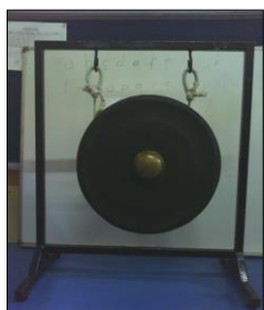
Gambar 2 . Instrumen Kempur berdiameter 47 cm (Foto : NR.Artana, 2012)

Selain menyebutkan nama alat-alat musik yang digunakan dalam bermain musik, bahan alat-alat musik juga diperkenalkan kepada peserta didik. Sehingga peserta didik mengenal lebih awal nama bahan-bahan alat musik. Adapun nama bahan-bahan alat musik antara lain besi, kayu, kulit sapi atau kerbau, bambu.