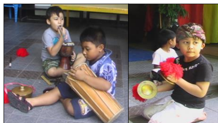
Gambar 6. Sikap peserta didik saat mengikuti pembelajaran seni

Pengenalan sikap-sikap tersebut di atas senantiasa diingatkan oleh gurunya ketika menjelang latihan musik, sehingga proses pembelajaran seni musik juga mengandung nilai-nilai edukasi. Untuk lebih jelasnya, berikut ditampilkan dalam bentuk gambar, sikap anak yang tidak wajar, belum bisa duduk bersila dan yang sudah bisa duduk bersila dari hasil observasi di lapangan.