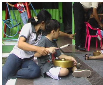
Gambar 7. Interaksi dan komunikasi dalam proses pembelajaran seni musik

Dalam proses bermain musik juga terjadi interaksi dan komunikasi antara guru dan peserta didik. Interaksi ini terjadi oleh karena proses bermain musik adalah sebuah transfer of skill untuk selanjutnya direspon oleh peserta didik.