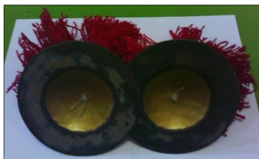
Gambar 4 . Instrumen Cengceng Kopyak

Gambar 3 adalah alat tingklik yang dipergunakan untuk memperkenalkan nada musik Bali. Di bawah ini juga ditampilkan gambar alat musik sebagai media stimulan kecerdasan anak. Alat musik tersebut adalah Cengceng Kopyak . Alat musik ini berjumlah 8 buah atau empat (4) pasang yang terbuat dari besi tipis.